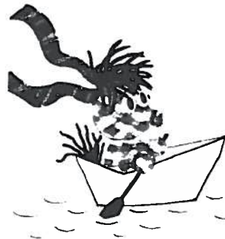
Das kleine ICH BIN ICH schippert in den unsicheren Gewässern der Identitätssuche.

Meist wird es von den Tieren als buntes Tier , als bunter Kleiner bezeichnet, immer etwas herablassend oder mitleidig oder gar kränkend, wie vom Papegei, der gleich das Bunte mit dem Adjektiv dumm in Verbindung bringt, wie auch am Anfang der Frosch. Das kleine ICH BIN ICH wird also eher als sächlich oder männlich adressiert und damit auch als solches figuriert, obwohl es doch irgendwie rund scheint – rund und bunt. Und wir dachten, dass das Runde eher mit „weiblich“ zusammen gedacht wird. Und so geht das runde, bunte Tier weiter, auch die Hunde schließen es aus, denn, hat es zwar Ohren wie ein Dackel, so sind doch die Beine nicht schön krumm,