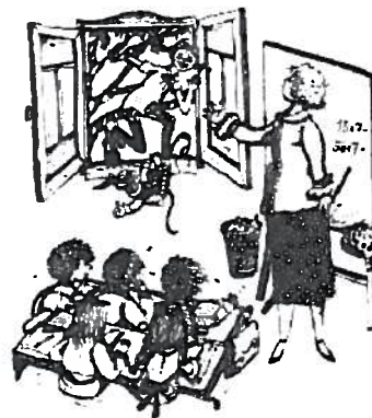
Pippi widersetzt sich Ordnungssystemen der Erwachsenenwelt. Ill. Rolf Rettich.

Auch wenn die Kinder einwenden, dass Pippi lügt, ist mit „Ägypten“, „Hinterindien“ und „Kongo“ eine Dimension eingeführt, die Konventionen als zeitlich und räumlich beschränkt erkennbar macht und sie damit als veränderlich kennzeichnet. Noch grundsätzlicher beharrt Pippi in diesem ersten Gespräch darauf, dass in einem freien Land jede/r tun könne, was sie/er wolle. Ihre Rolle bleibt jedoch festgelegt darauf, dass sie merkwürdig ist und ihr Verhalten und Denken stets erklären, begründen, rechtfertigen muss. Der Text hat damit einerseits eine kritisch-satirische Ebene, die sich über die Engstirnigkeit und Spießigkeit der Kleinstadt-BewohnerInnen lustig macht und als Plädoyer für mehr Freiraum in jeder Hinsicht gelten kann. Andererseits wendet sich der Witz gegen das „Andere“ selbst: Es hat seine Funktion darin, im größtmöglichen Kontrast, gesteigert bis zur Groteske