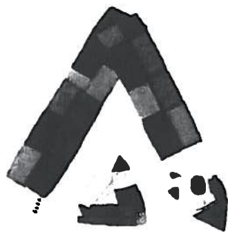
Rund und eckig als geschlechtsspezifische Figurenmerkmale? Ill. Kveta Pacovská

Wie funktioniert ein Oppositionspaar, wie kann es dekonstruiert werden, wie kann seine Dekonstruktion gelesen werden? Und was ist Dekonstruktion überhaupt? Der theoretischen Schule der Dekonstruktion, deren Begründer der Philosoph Jacques Derrida war, geht es um die Dekonstruktion einer Denkweise, die von ihm als Logozentrismus bezeichnet wurde. 2 Es geht also um den Logos und um Zentren. Der Terminus Logos ist bedeutungsmäßig