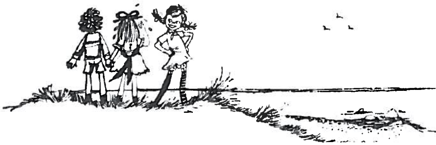
Tommy, Annika und Pippi: Symbolfiguren für das angepasste und unangepasste Kind. Ill. Rolf Rettich.

Gegensatz, die „wilde“ Unordnung. Diese andere Ordnung wird aber, so scheint es zunächst, gar nicht abgewertet, sondern wider Erwarten als „eigentlich schön“ präsentiert. In dieser Darstellung ist Pippi als lustige, phantasievolle, starke Ausnahmefigur eine märchenhafte Fiktion. Vor allem ihre übernatürlichen körperlichen Kräfte konterkarieren das typische Bild vom schwachen Mädchen, aber auch ihre Art sich zu kleiden, ihre Interessen und ihr gesamtes Verhalten stehen außerhalb konventioneller Geschlechterrollen.