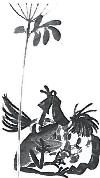
„Du bist du!“, quakt der Laubfrosch als Erkenntnis dem kleinen ICH BIN ICH ins Ohr. Ill. Susi Weigel.

Was wir für „Pippi Langstrumpf“ und für „Das kleine ICH BIN ICH“ versucht haben, lässt sich natürlich mit jedem Text machen. Das vorgestellte Verfahren einer dekonstruktiven Lektüre braucht kein Kinder- und Jugendbuch mit unkonventionellen HeldInnen und Geschichten. Gerade solche Bücher, die traditionelle Geschlechterrollen oder andere Stereotype beschreiben, bedürfen aus unserer Sicht eines solchen kritischen Blicks. Unsere Erfahrung zeigt, dass SchülerInnen ebenso wie StudentInnen diese In/Fragestellungen sehr interessiert aufgreifen und oft mit der eigenen Lebens- und Leseerfahrung verknüpfen können. Dass man diese Arbeit je nach Altersstufe methodisch anders aufbereiten muss, ist gewiss herausfordernd, aber – wie wir meinen – eine wertvolle Chance für die Texte wie für die LeserInnen.