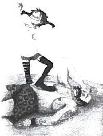
Pippi feiert ihren Sieg über den starken Adolf im Zirkus. Ill. Katrin Engelking

und Absurdität, das sonst Unwidersprochene zu konterkarieren. Das „Andere“ kommt darüber hinaus nicht vor; es geht nicht darum, wie etwa Menschen in Brasilien oder Guatemala wirklich leben. Diese Auslassung betrifft die „fremden Länder“ und die dort lebenden „fremden Leute“ ebenso wie Pippis Art, ein „Mädchen“ zu sein.